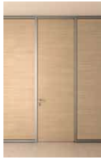
Solid swing door

perfecta complanariedad del lemento, máxima hermeticidad érmica y acústica, paneles nchapados de clase E1, tiradores ush/pull o con palanca: la calidad e Aria se ve en cada componente ividual, como en todas las oluciones Babini Office.