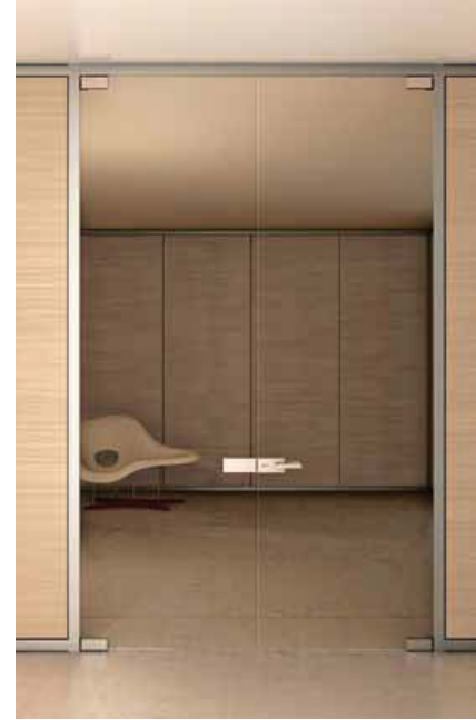
Glass swing door