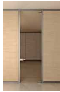
Glass swing door