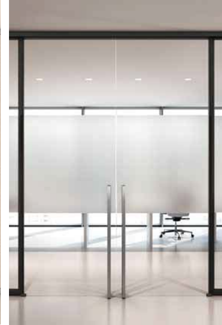
Glass sliding door