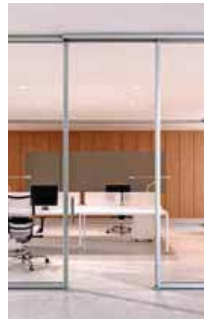
Glass sliding door