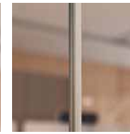
Satined polycarbonate profile