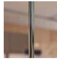
Transparent polycarbonate profile